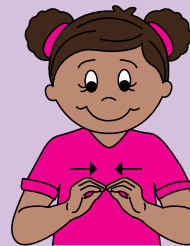
more Bring fingertips together a few times.