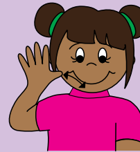
mommy With open hand, tap chin twice.