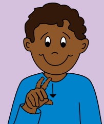
no First two fingers close down to touch extended thumb.